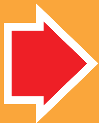
すっごく速い金具用ビス