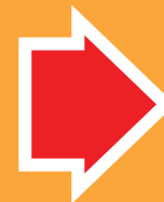
すっごく速い金具用ビス